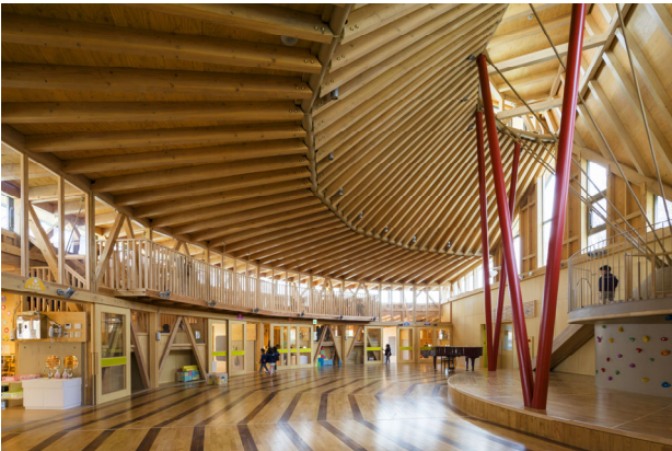
ちぐさこども園／仙田満+環境デザイン研究所