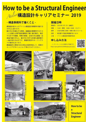
構造設計キャリアセミナー案内