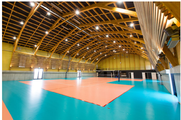
オガールベース／らいおん建築事務所+木村設計 AT