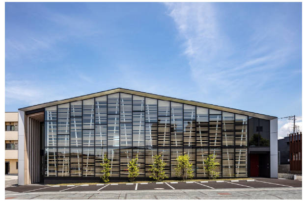
あさひ会計セミナー棟 古谷誠章+NASCA